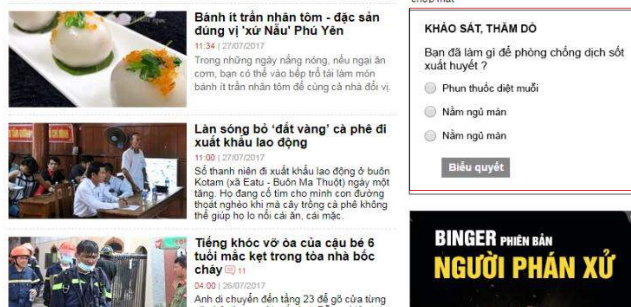
Demo Box Khảo sát, thăm dò 300x250 đặt trong trang chuyên mục